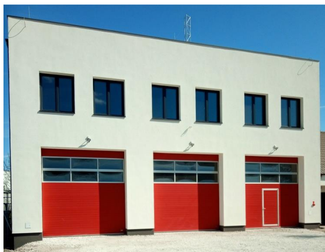
Fot. Remiza OSP w Pruszczu

Gmina Pruszcz przyznała również dotację celową w kwocie 652.000,00 zł. na rozbudowę remizy OSP w Pruszczu.