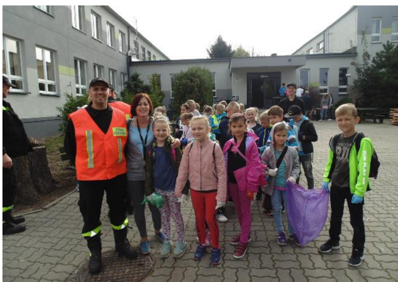
Fot. Sprzątanie Świata w Serocku

Co roku organizowany jest Dzień Ziemi i akcja Sprzątania świata przez placówki oświatowe z udziałem uczniów na terenie Gminy Pruszcz, akcję wspomaga corocznie UG Pruszcz.