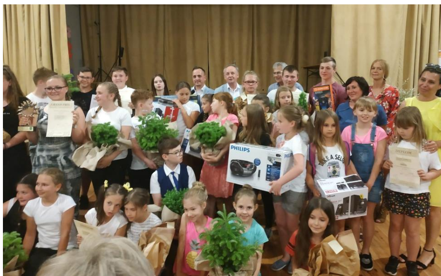
Fot. Grupa „Spoko-Loko” SP Łowinek - Kuchenne rewolucje - laureaci Grand Prix

- 11 czerwca 2019 r. na XX Przeglądzie Teatrów Ekologicznych w Łowinku dzieci i młodzież zaprezentowały spektakle ekologiczne nawiązujące do dbania o środowisko przyrodnicze.