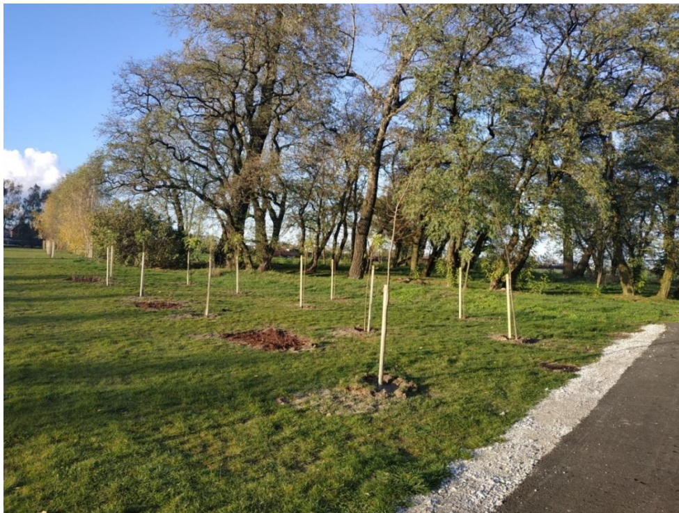
Fot. Nasadzenia drzew i krzewów w Pruszczu na boisku, przy ul. Sportowej.

Nowe nasadzenia zostały wykonane z myślą o mieszkańcach dla wzbogacenia estetyki krajobrazu i zieleni w naszej Gminie. Ponadto miododajne drzewa i krzewy pozytywnie wpływają na populację pszczół.