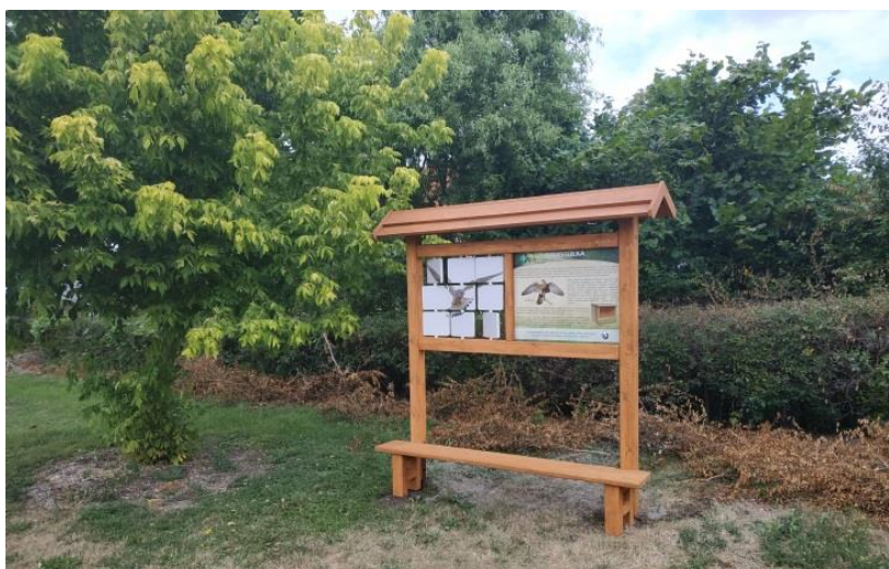
Fot. Ścieżka dydaktyczna przy SP w Serocku z nową grą plenerową.

Doposażono ścieżkę dydaktyczną przy Szkole Podstawowej w Serocku poprzez budowę budki lęgowej dla pustutki i tablicy edukacyjnej. Na ten cel pozyskano dofinansowanie ze Starostwa Powiatowego w Świeciu (koszt inwestycji 3000,00 zł).