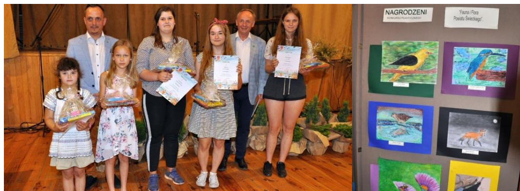
Fot. Wręczenie nagród laureatom konkursu plastycznego

- Podczas przeglądu teatrów wręczono również nagrody laureatom konkursu plastycznego pt.: „Flora i fauna powiatu świeckiego - IV edycja”