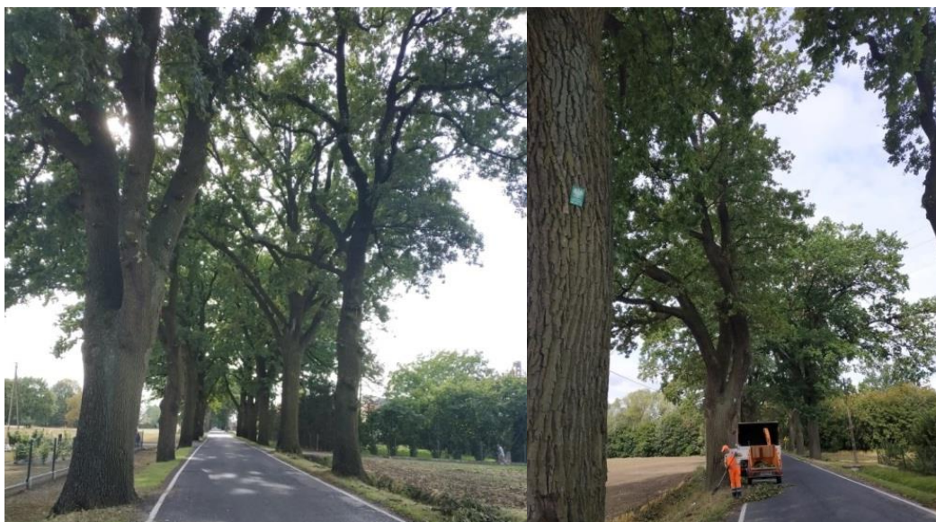
Fot. Pielęgnacja pomników przyrody w m. Łowinek.