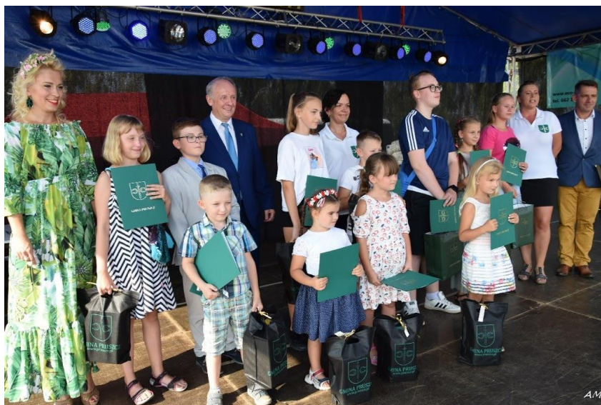
Fot. Wręczenie nagród laureatom

- W kwietniu 2019 r. Gmina Pruszcz włączyła się wspólnie z placówkami oświatowymi w akcję Fundacji ARKA Listy dla Ziemi 2019 r. promującą gospodarkę niskoemisyjną oraz postawy i działania proekologiczne. Na Dożynkach Gminnych laureaci najpiękniejszych listów zostali nagrodzeni przez Wójta Gminy Pruszcz.