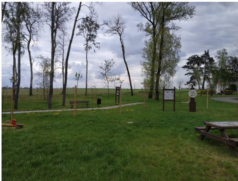
Fot. Park przy ul. Okrężnej w Pruszczu z nowym doposażeniem gier plenerowych.

Doposażono ścieżkę edukacyjną przy ul. Okrężnej w Pruszczu. Zamontowano grę plenerową „Koło wiedzy” oraz dwie sztuki ławostółów z grami planszowymi. Na ten cel Gmina pozyskała dofinansowanie z Wojewódzkiego Funduszu Ochrony Środowiska i Gospodarki Wodnej w Toruniu (koszt całego zadania 5 560 zł, kwota dofinansowania 2 699 zł).