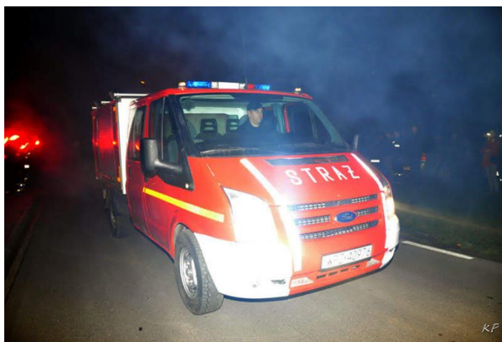
Fot. Wóz bojowy OSP Parlin

Gmina Pruszcz przyznała również dotację celową w kwocie 652.000,00 zł. na rozbudowę remizy OSP w Pruszczu.