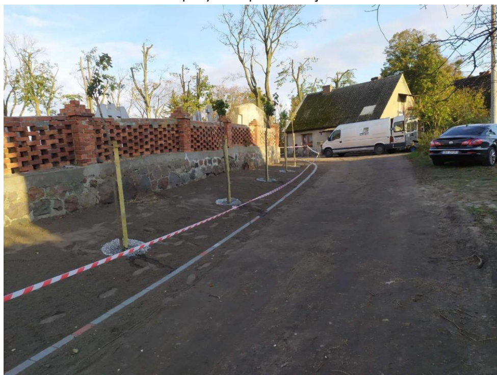
Fot. Nasadzenia drzew w Serocku przy drodze gminnej.