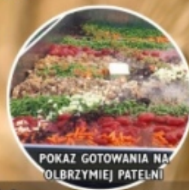
POKAZ GOTOWANIA NA OLBRZYMIJ PATELNI