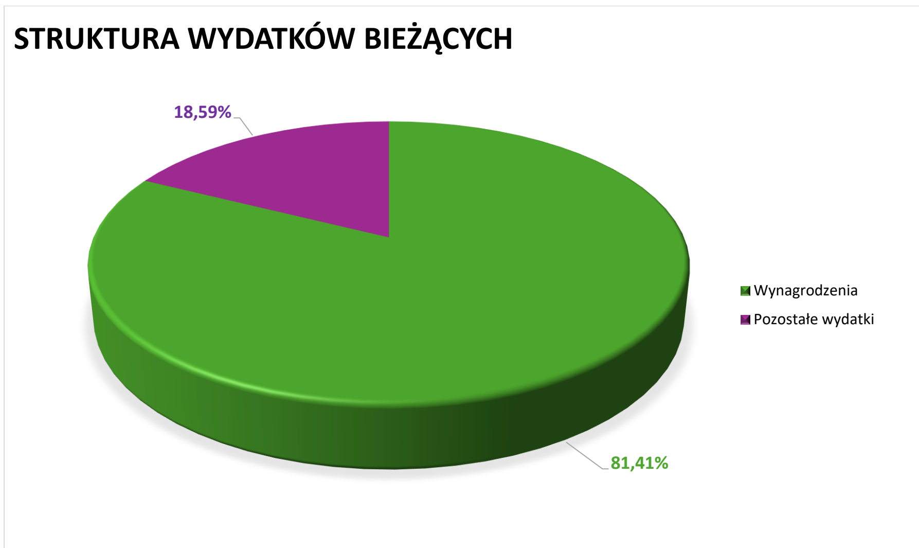
Wykres 3. Struktura wydatków bieżących