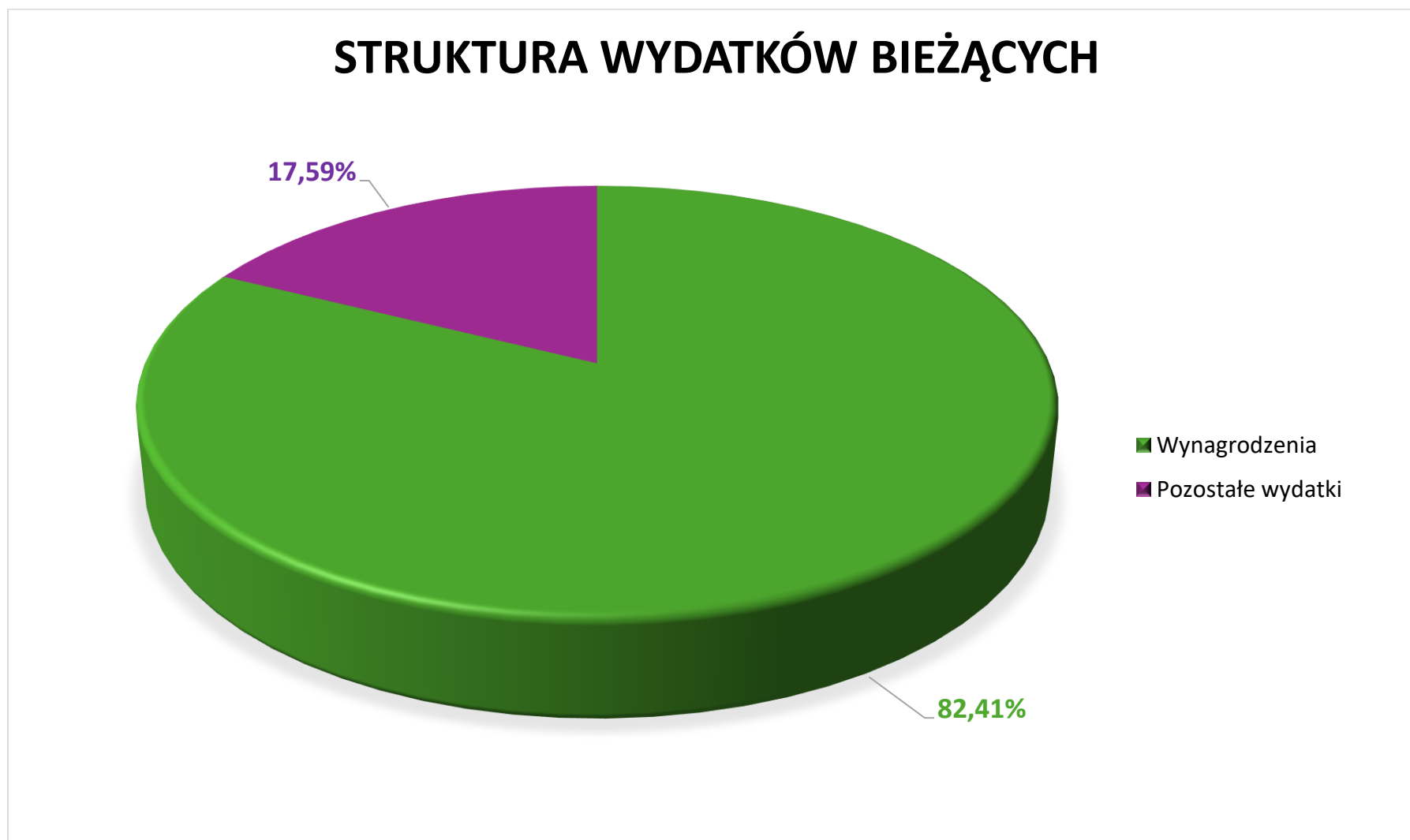
Wykres 3. Struktura wydatków bieżących